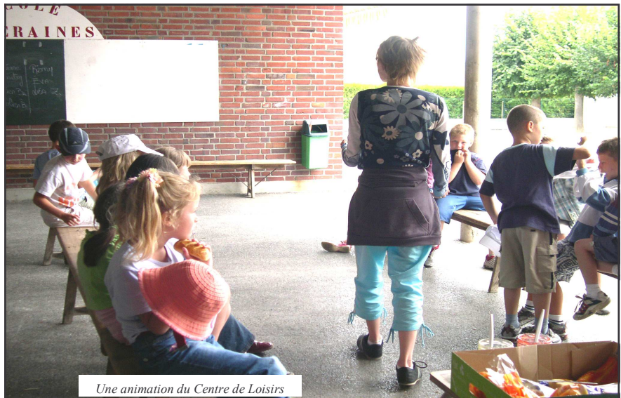
Une animation du Centre de Loisirs

La remise du traditionnel colis et le goûter des anciens aura lieu le Mercredi 14 Décembre à 16 heures, salle Maurice