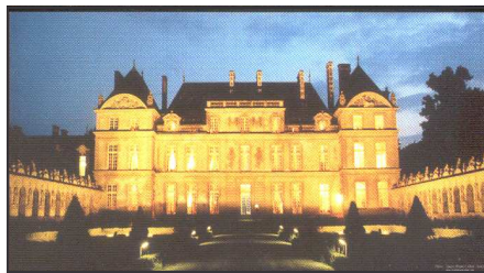
Le Château de Raray

Changement de paysage cette année, il aura lieu au Château de Raray le Jeudi 24 Novembre à midi.