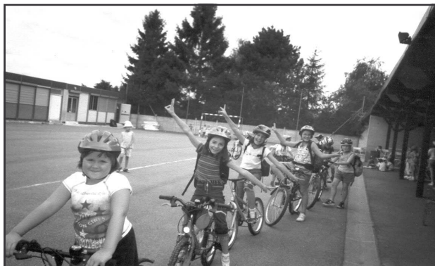
Départ pour une sortie « rallye vélo »