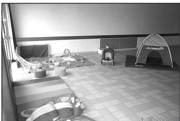
Nos trois photos ci dessus : un aperçu des équipements

Ou sur place lors des garderies ou encore retirer en mairie les dossiers d'inscription.