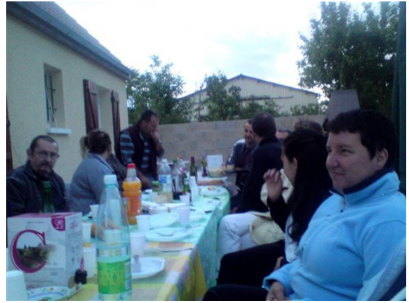
Rue de Flandres, le 27 mai