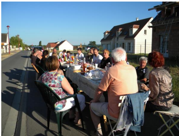
Rue Désiré Eve, le 2 juin