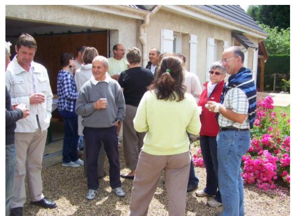
Impasse du Clos des Chapeaux et Rue de l'Avenir (du n°11 au n°26), le 18 juin