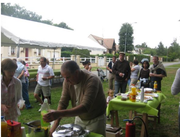
Rue du Bois du Jonc, le 12 juin