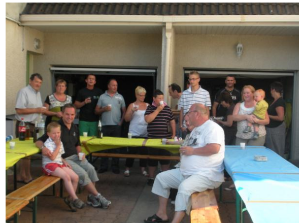
Rue du Poncelet, le 2 juin