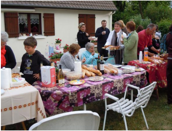
Rue du Marais, le 27 mai

La traditionnelle « Fête des Voisins » s'étend sur St Martin Longueau, toujours dans la bonne humeur et la convivialité, les voisins de différents secteurs de la commune se sont réunis autour d'un repas, certains pour la première fois et d'autres depuis plusieurs années.