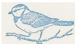
CLUB DES MESANGES Les Anciens de St Martin Longueau

Le 29 mars à la salle des loisirs, nous avons fait un repas gratuit suivi d'un loto alimentaire. Nous avons passé une excellente journée pleine de joie et, pour quelques heures, nous avons oublié nos soucis.