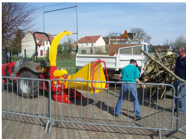
Démonstration de broyage des végétaux par notre personnel technique

Pour obtenir un composteur contactez la CCPOH au 03 44 70 71 34