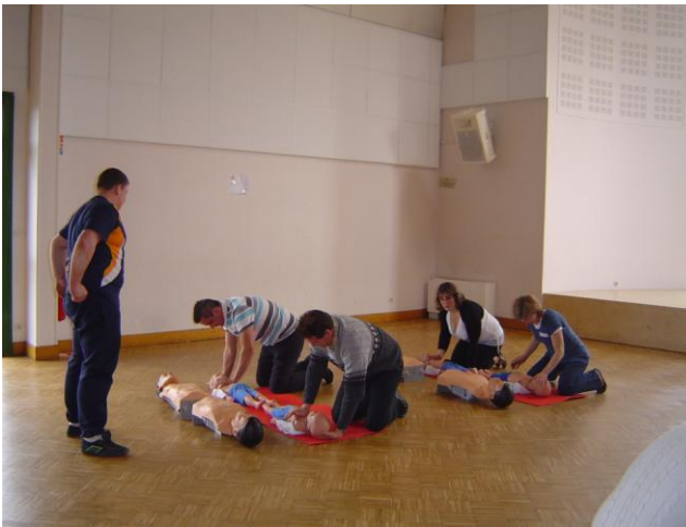
réanimation d'un enfant