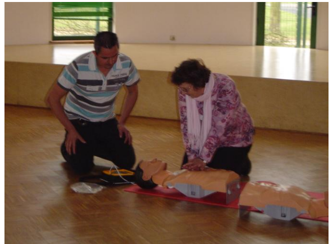
massage cardiaque et utilisation du défibrillateur