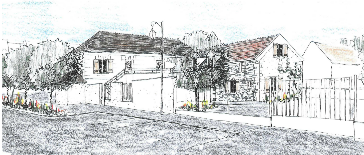
VUE DE L'ARRIERE DEPUIS LE PARKING