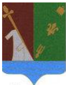
St Martin Longueau